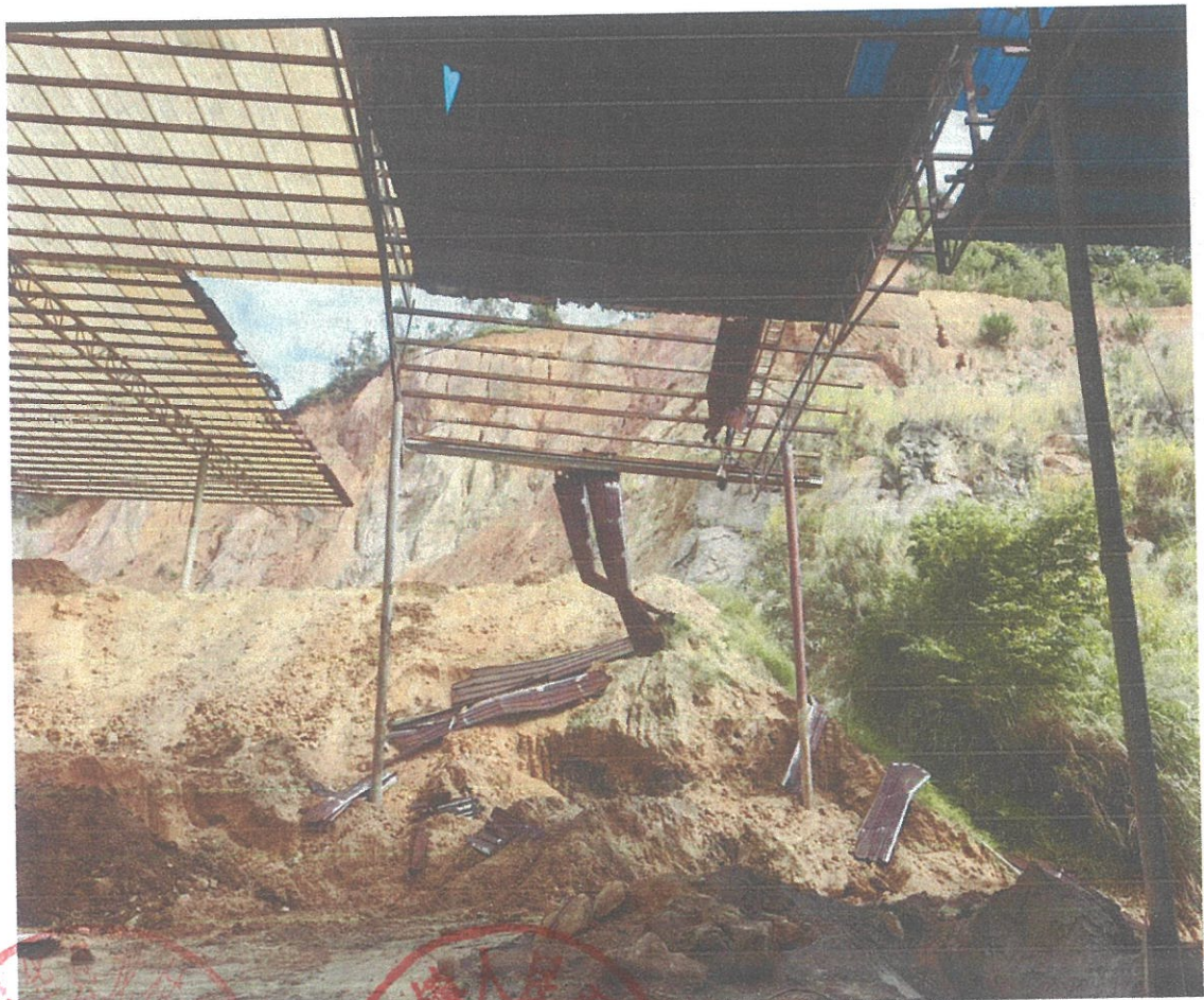
新树立柱和拆除旧棚面过程