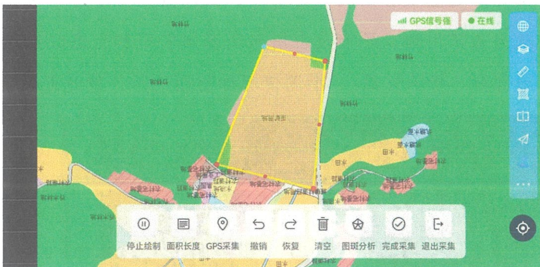
图三 三调数据现状图