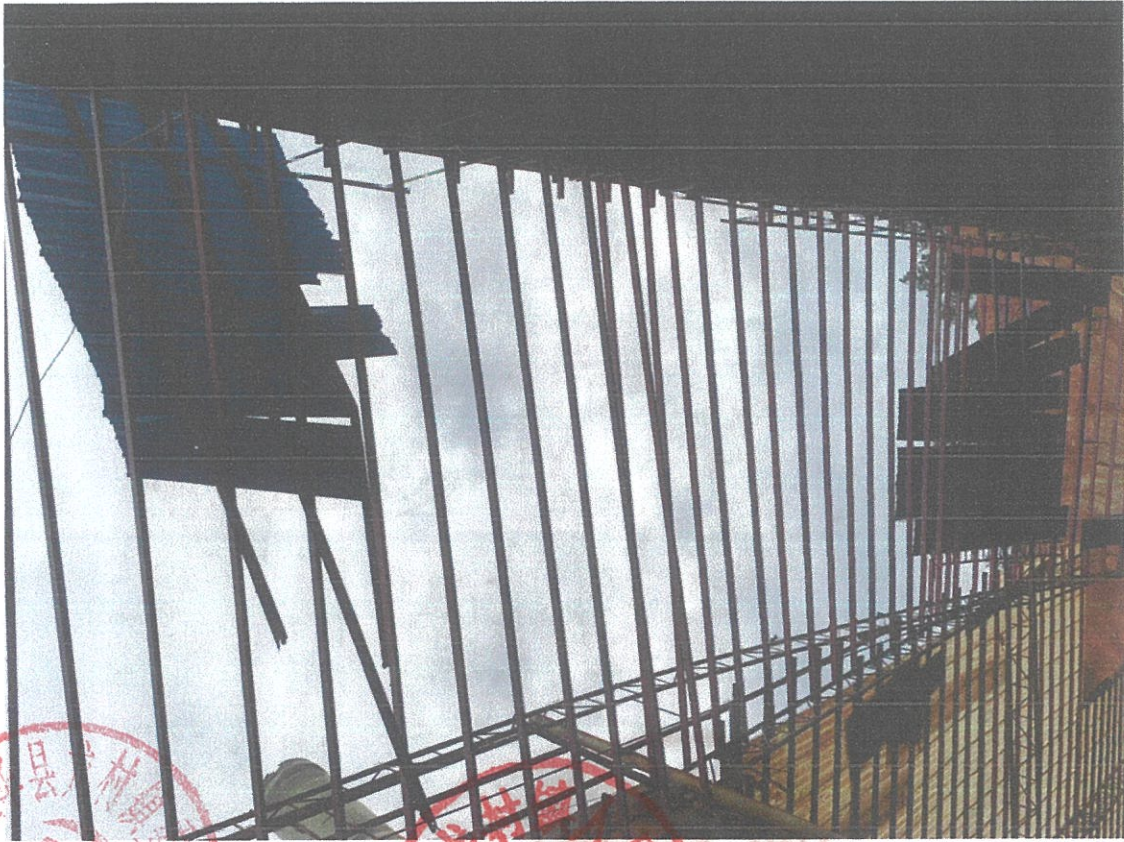
拆除旧棚顶和钢架过程