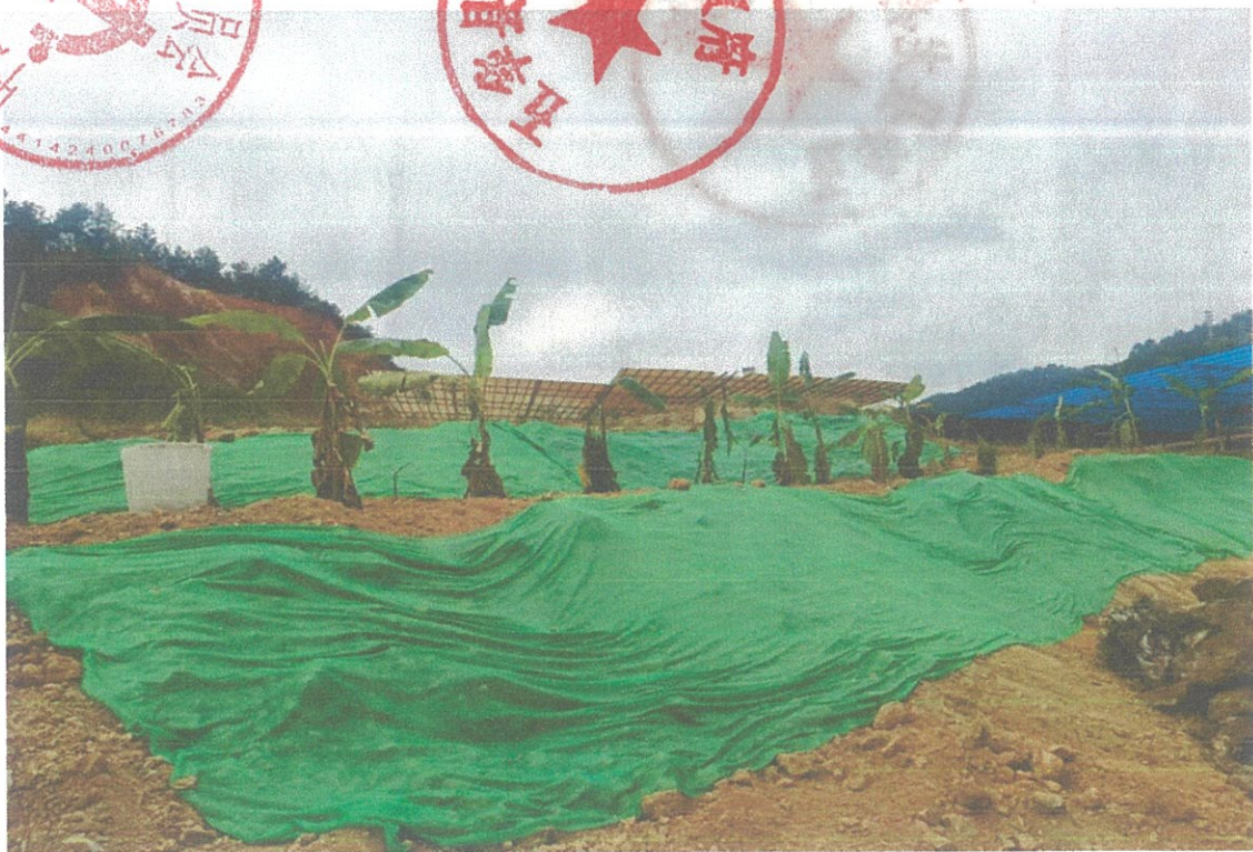
重新复绿的林地部分