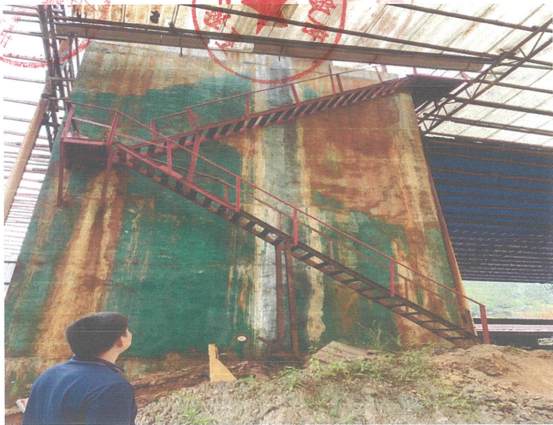
加固后的脱硫塔楼梯