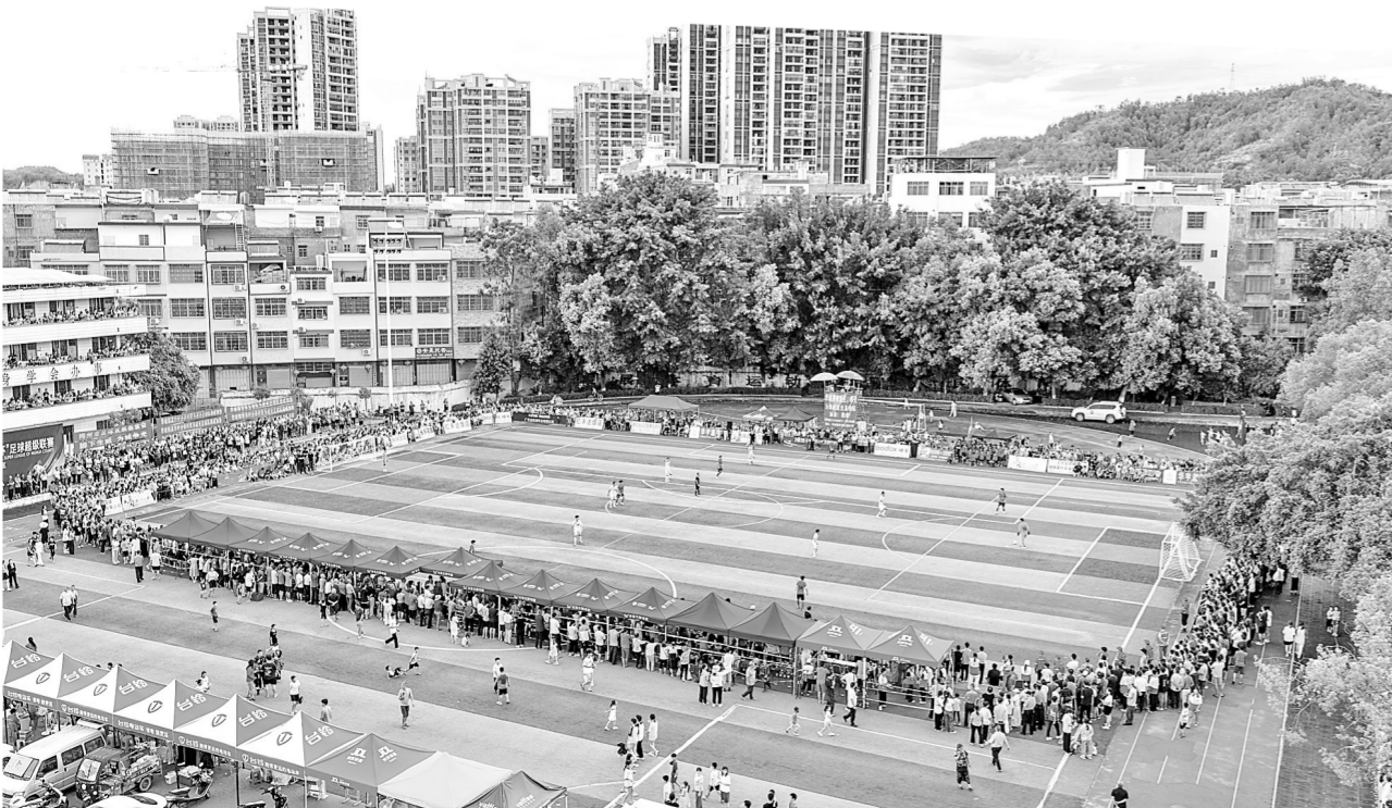
五华“球王杯”足球超级联赛举办,得到广大群众和各界点赞参与。