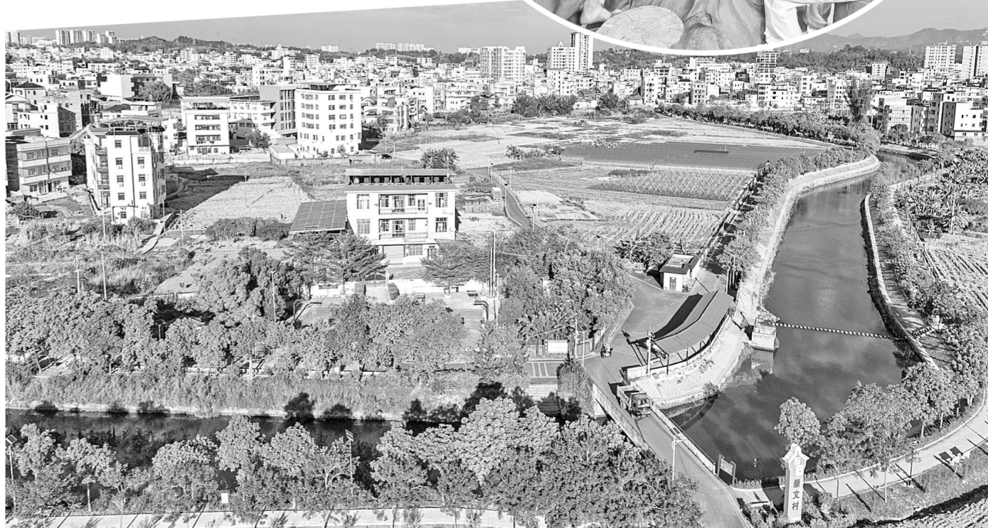
在“百千万工程”推动下,五华镇村面貌焕然一新。