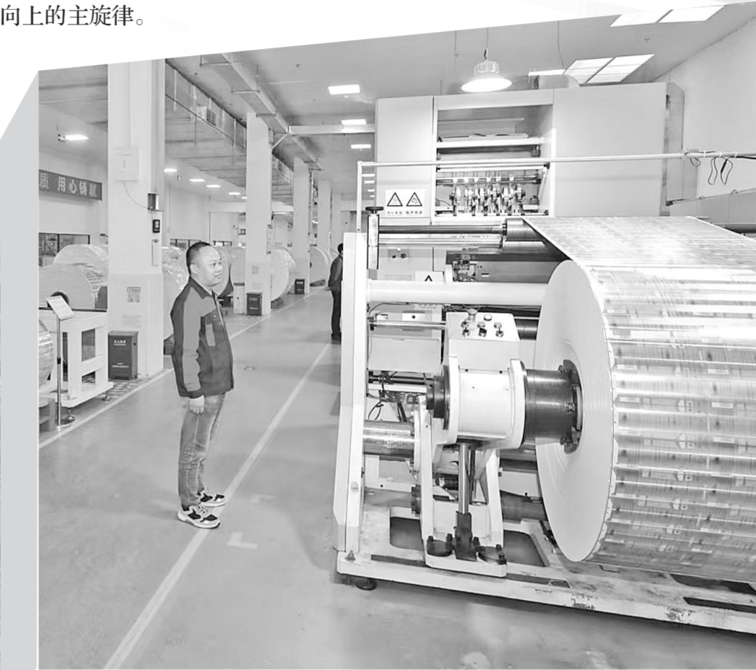
五华坚持实体经济为本,制造业当家的底子日益厚实。