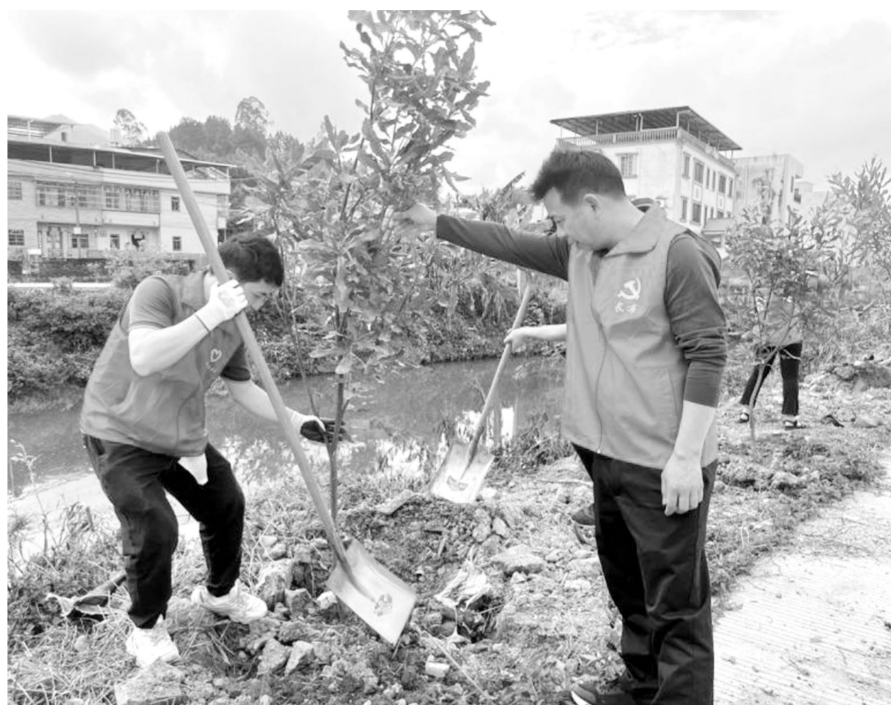
长布镇组织干部群众在太平村沿河边种植坚果苗。

五华县大力倡导绿色低碳新年俗,推动“爆竹声声”向“绿意浓浓”转变,全域推广“少放一围鞭炮,多种一棵绿树”行动,引导群众以植树栽花替代燃放烟花爆竹,优先选种坚果、三华李等经济苗木,既减污防火保安全,又增绿添美促增收。同时,五华推行鲜花祭祀、植树缅怀,在宗祠周边、村道沿线打造“祈福